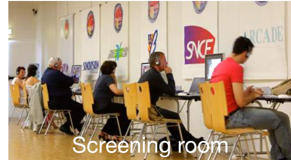
Screening room Vidéothèque des films en compétition + accès QR