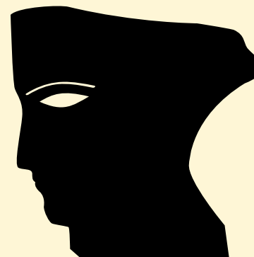
TROPHÉE CÉSAR & TECHNIQUES