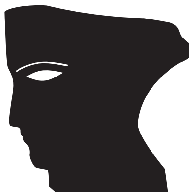
Trophée César & Techniques

2020 Transpalux / Studios de Bry 2019 Poly Son Post Production 2018 Mikros Image Technicolor 2017 Tapages & Nocturnes 2016 M141 2015 Poly Son Post Production 2014 Transpalux 2013 Mikros Image 2012 Mikros Image 2011 Archipel Productions