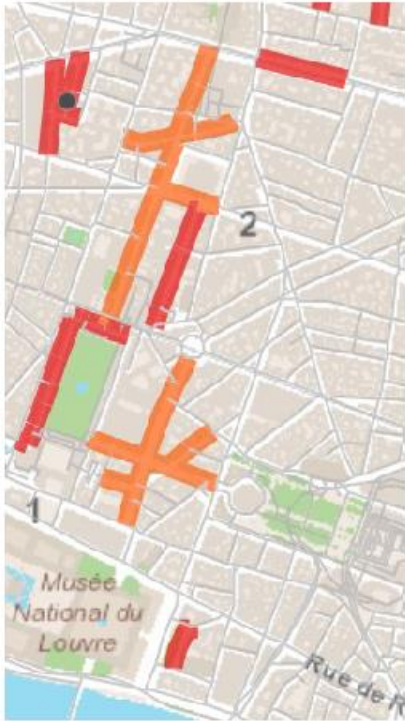
Vue d'ensemble des rues interdites (stationnement) dans le centre de Paris : Ex. : 1 er et 2 ème arrondissement